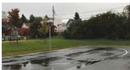
Demi-terrain de basket au Parc Ernest-Bergeron

Accès à la rivière au parc Willie-Bourassa-Auger