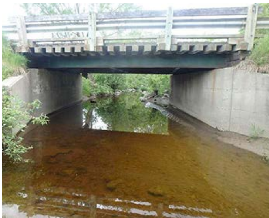
Photo du pont Wilfrid-Proulx en 2014

Une autre section du chemin, détachée du premier, mais portant le même nom, est ouverte vers 1868 à environ 1,2 km plus à l'ouest, entre les 6 e et 7 e Rang. Cette dernière section prend le nom de chemin Blais probablement vers 1958 et devient le chemin Albert-Nicol en 2006.