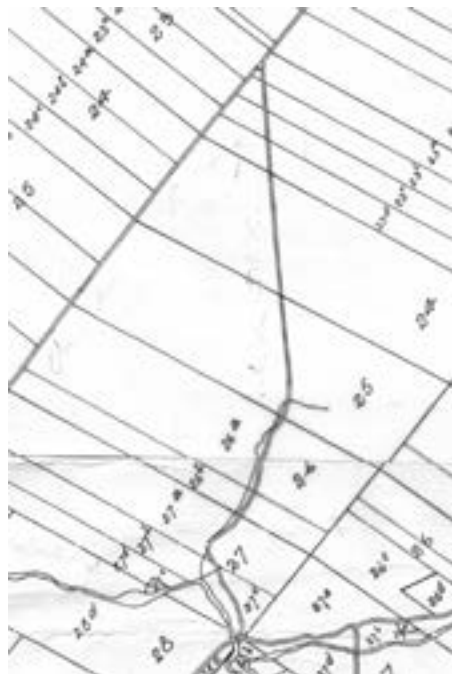
Plan du chemin du rang V construit entre les lots 23 et 27 du rang V (Plan officiel du canton Brompton, comté de Richmond en 1901)

Le chemin longe sinueusement le côté nord du ruisseau Saint-François et, à partir d'un pont sur ce dernier, il se redresse de façon rectiligne vers le chemin du 6 e Rang. Lors de la réunion du 21 juillet 1862 du conseil municipal du canton de Brompton, on mentionne bien que ce chemin existe déjà. Il n'est donc pas créé en 1873, comme l'indique l'abbé Albert Gravel dans son livre Sainte-Praxède de Brompton en 1921. Même si on ne sait pas depuis quand exactement le chemin porte son nom, il est probable que ce soit depuis le début comme c'était la coutume à l'époque. Le chemin traverse le ruisseau Saint-François, affluent du ruisseau Kee, par le pont Wilfrid-Proulx. Ce pont à poutres d'acier, qui a encore son tablier en bois, date probablement de 1963